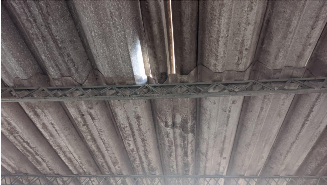
FOTO 4 - Telha de fibrocimento danificada

ESTADO DE SERGIPE PREFEITURA MUNICIPAL DE AQUIDABÃ Av. Marcelo Déda Chagas,1632 - Aquidabã/SE CEP: 49790-000