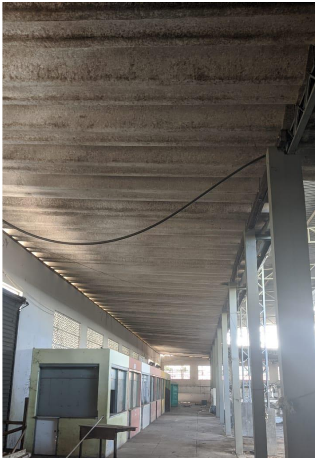
FOTO 1 – Telhado do núcleo central que será removido e servirá como empréstimo para substituição de algumas telhas que apresentam imperfeições em outras área do mercado como mostram as próximas figuras.