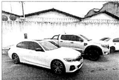
VEÍCULOS E IMÓVEIS avaliados em R$ 2,5 milhões são apreendidos em Lagarto

Cerca de R$ 2,5 milhões em bens, incluindo veículos e imóveis, foram apreendidos em Sergipe durante operação de cumprimento de decisões judiciais para localização de patrimônio pertencente a uma organização criminosa de Bahia. Os bens apreendidos pertenciam a um investigado que se mudou para o território sergipano para conduzir operações financeiras da organização criminosa. A ação policial, deflagrada pela Divisão de Narcóticos da Delegacia Regional de Lagarto, foi divulgada nessa quarta-feira, 21.