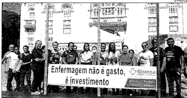
SINTASA CRITICA falta de compromisso por parte da gestão em relação às negociações

O Sintasa destacou que a principal motivação por trás da paralisação é chamar a atenção para o que eles consideram uma falta de compromisso por parte da gestão em relação às negociações que envolvem a implementação adequada do piso salarial