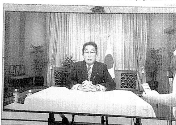
FUMIO ordenou ao governo que continue a prestar apoio à Ucrânia e a impor sanções à Rússia

O primeiro-ministro do Japão, Kishida Fumio, ordenou ao governo que continue a prestar apoio à Ucrânia e a impor sanções à Rússia por meio da coordenação próxima com os demais parceiros do grupo das sete potências econômicas do mundo (G7). Kishida deu as instruções durante reunião com ministros, nesta terça-feira (23), na véspera dos seis meses da invasão da Ucrânia pela Rússia.