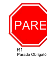
R1 Parada Obrigatória