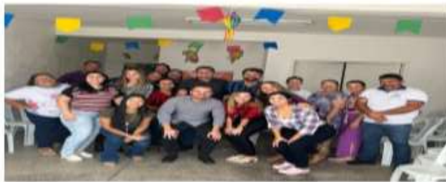
Comemoração do dia dos pais de pacientes e cuidadores