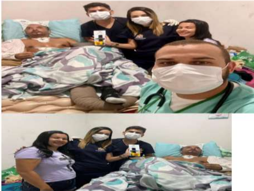
Comemoração de dois anos do Programa Melhor em Casa