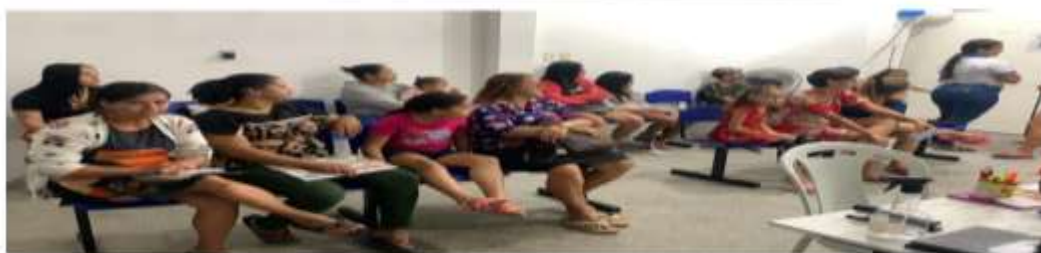
Dia D de atualização da caderneta de vacinação UBS Getúlio Vargas