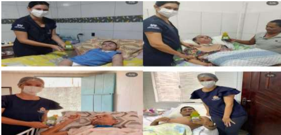
Demais terapias do dia a dia