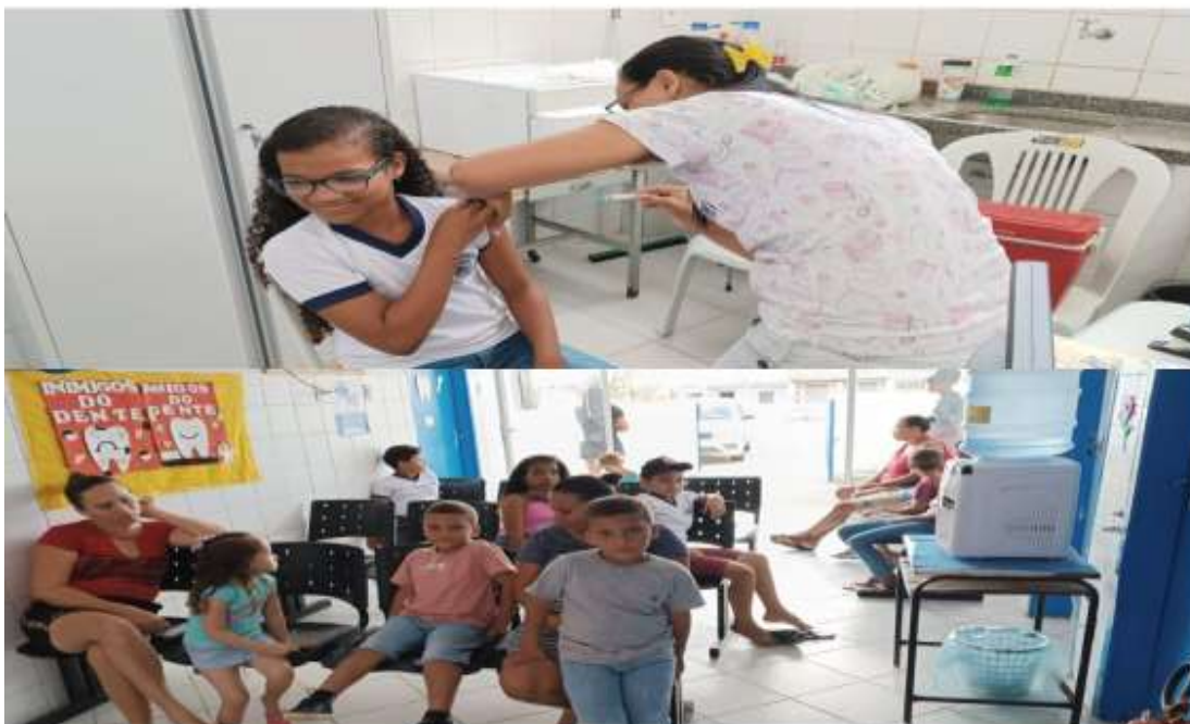
Intensificação no trabalho de prevenção do Aedes Aegypti no Povoado Segredo com palestra na escola