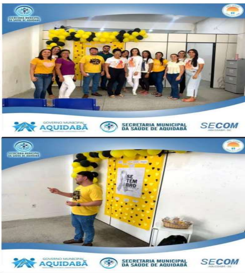
Dia D de atualização da caderneta de vacinação UBS Paraguai