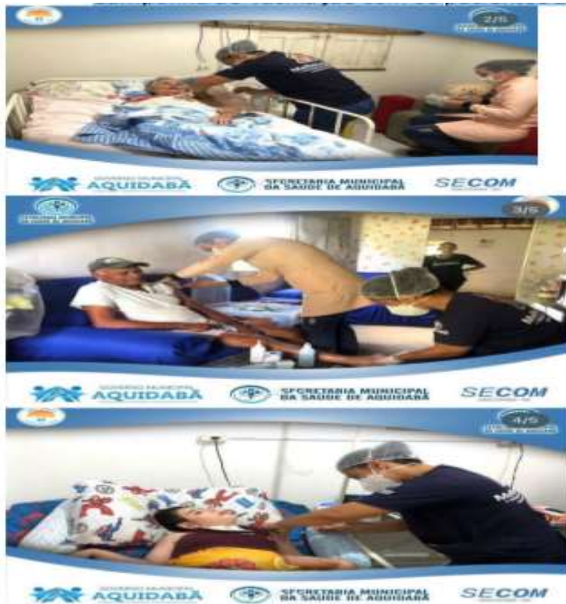
Comemoração do dia dos pais de pacientes e cuidadores