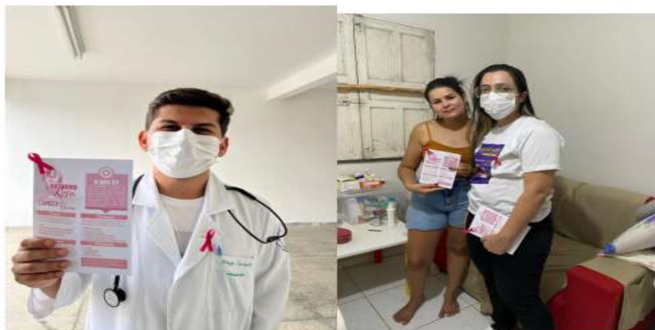
Novembro Azul – Ação de conscientização para prevenção e diagnóstico do câncer de próstata