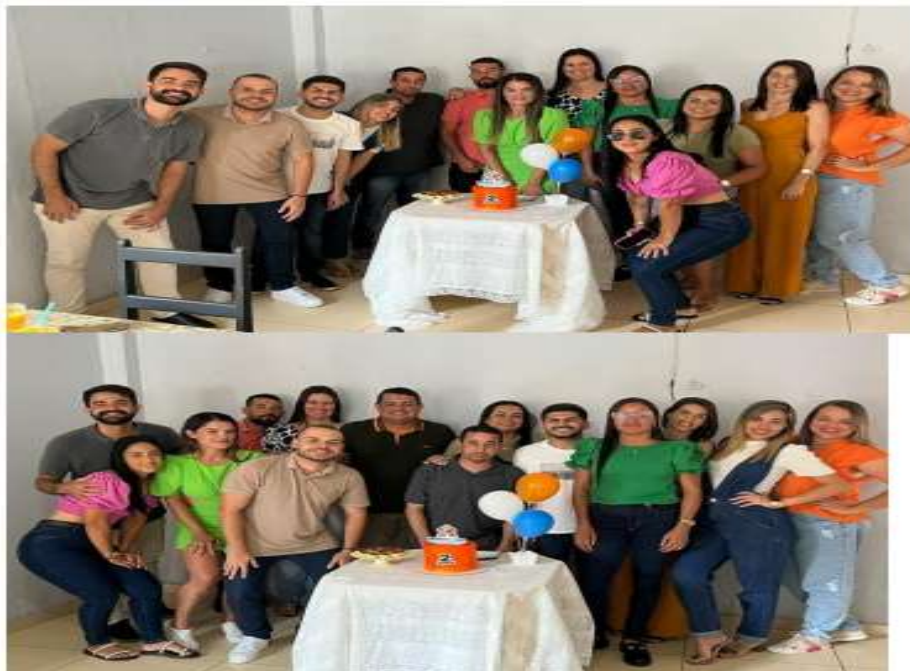
Ação para prevenção e diagnóstico do câncer de mama – outubro rosa